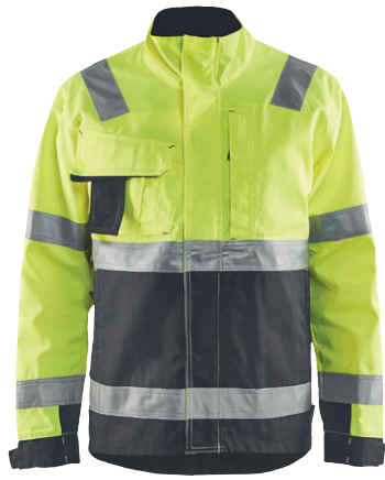
4064 / HIGH VIS JACKE / 95.90€