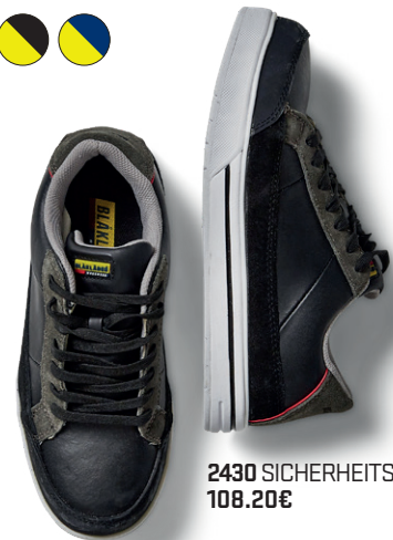
2430 SICHERHEITSSCHUH S1P 108.20€