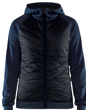
3464 / DAMEN HYBRID SWEATER / 79.90€