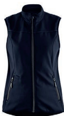
3851 / DAMEN SOFTSHELL WESTE / 51.00€