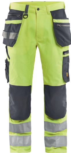
1592 / HIGH VIS ARBEITSHOSE MIT STRETCH / 119.00€