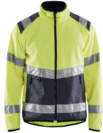
4877 / HIGH VIS SOFTSHELL JACKE / 95.00€