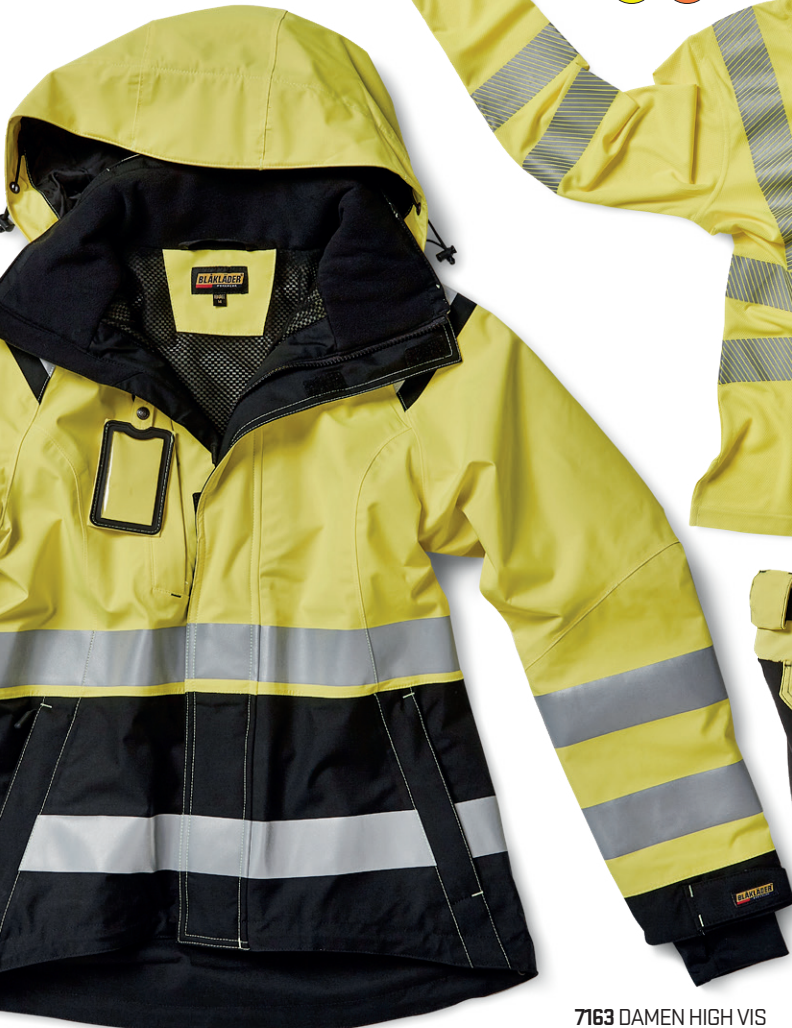
4904 DAMEN HIGH VIS SHELL JACKE 166.00€