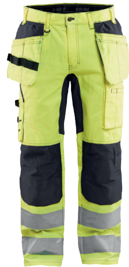
1552 / HIGH VIS ARBEITSHOSE MIT STRETCH / 92.50€