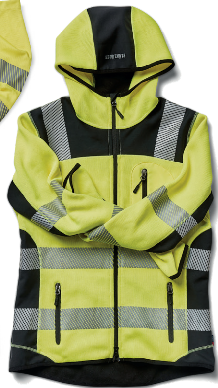
4967 DAMEN HIGH VIS STRICKJACKE 96.90€