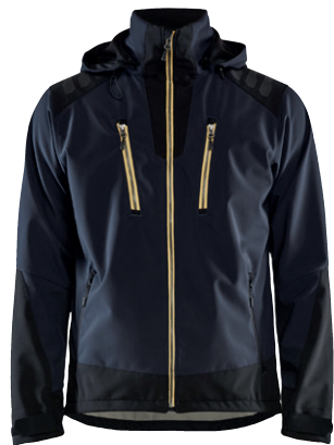
4749 / SOFTSHELL JACKE / 119.00€