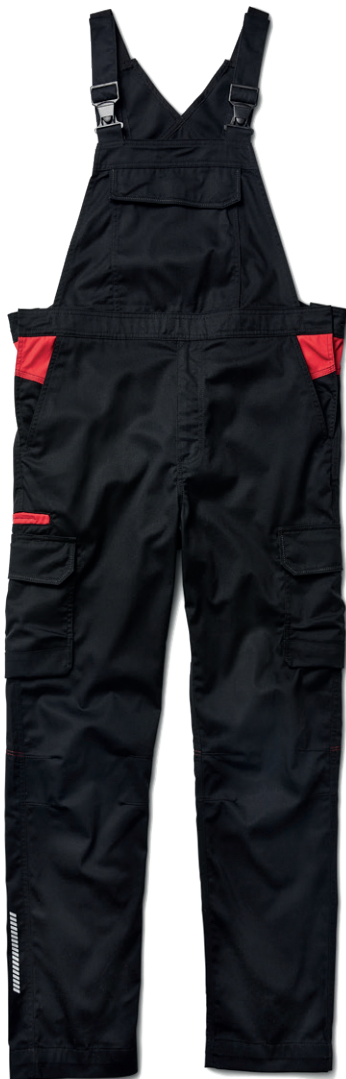
2644 INDUSTRIE LATZHOSE 73.00€