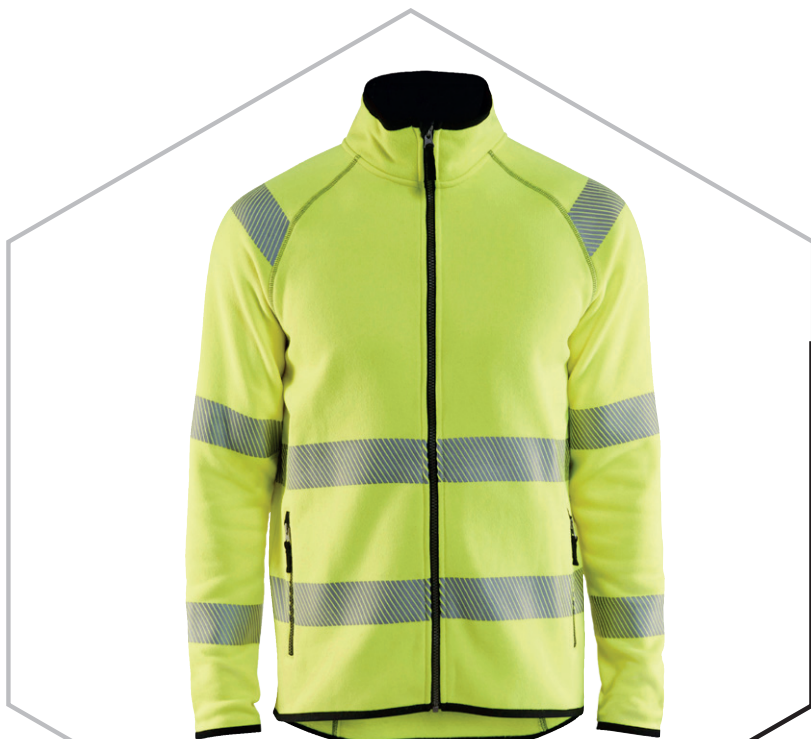
4922 HIGH VIS STRICKJACKE 91.90€