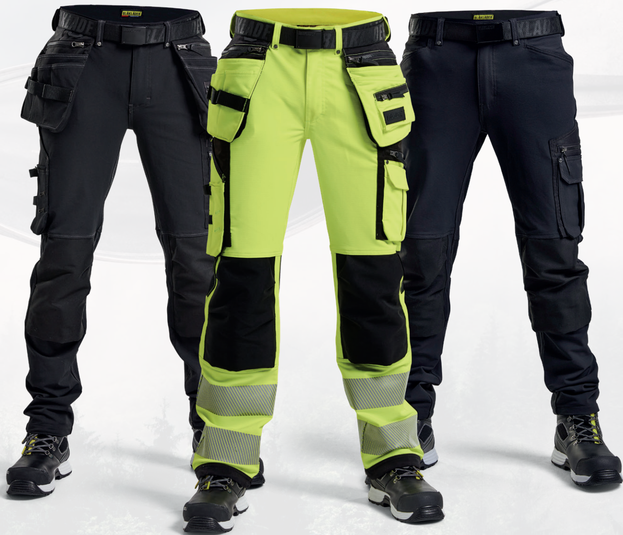
1998 HANDWERKER ARBEITSHOSE 4-WEGE-STRETCH X1900 143.50 €

Mit weichem Mesh-Stretch erleben Sie gute Belüftung kombiniert mit CORDURA®-Stretch für eine bessere Bewegungsfreiheit. Sobald Sie sie anprobiert haben, möchten Sie sie nicht mehr ablegen.