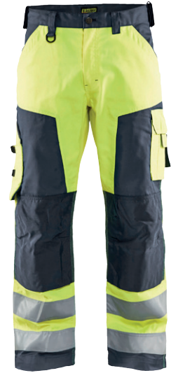
1566 / HIGH VIS ARBEITSHOSE OHNE NAGELTASCHEN / 83.90€