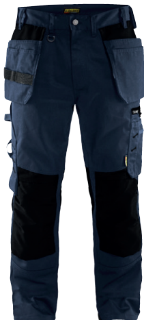
1555 / HANDWERKER ARBEITSHOSE / 72.50€