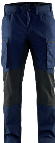
1459 / SERVICE ARBEITSHOSE STRETCH / 73.90€