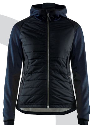
5931 / DAMEN HYBRID JACKE / 99.00€