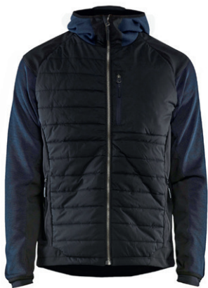
5930 / HYBRID JACKE / 99.00€