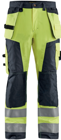
1568 / HIGH VIS HANDWERKER ARBEITSHOSE / 84.90€