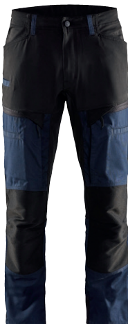
1456 / SERVICE ARBEITSHOSE / 76.50€