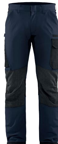
1422 / SERVICE ARBEITSHOSE 4-WEGE-STRETCH / 95.90€