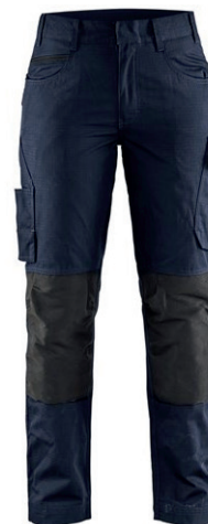
7195 / DAMEN SERVICE ARBEITSHOSE MIT STRETCH / 62.90€