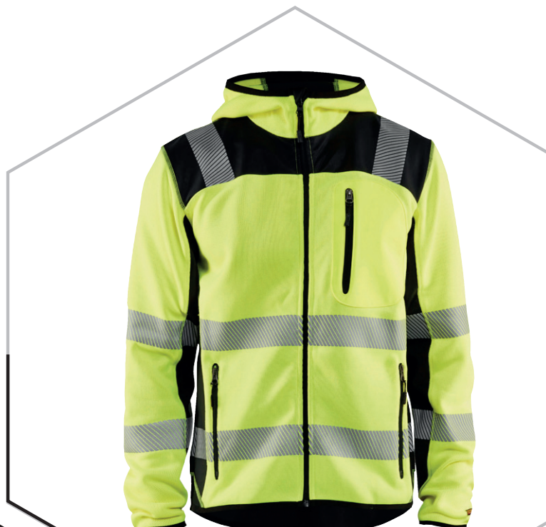
4923 HIGH VIS STRICKJACKE 96.90€