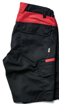
1446 INDUSTRIE SHORTS STRETCH 46.00€