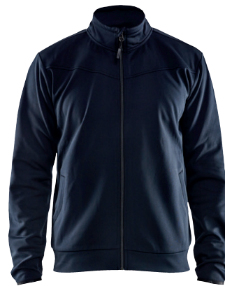
3362 / SWEATJACKE MIT REISSVERSCHLUSS / 43.90€