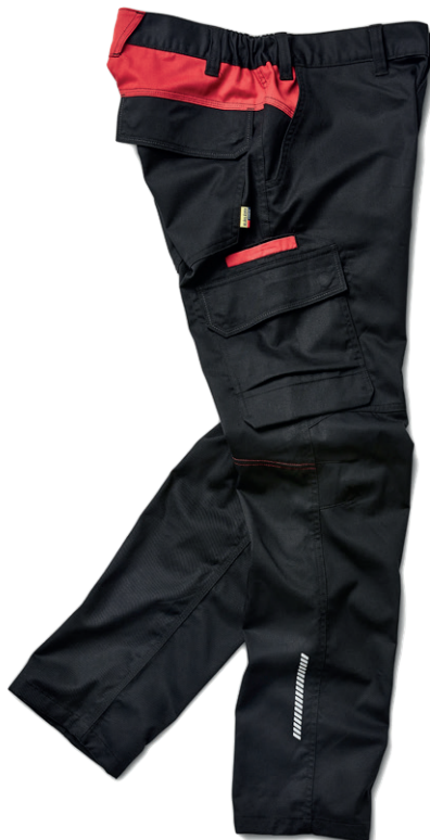
1444 INDUSTRIE ARBEITSHOSE STRETCH 49.00€