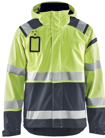
4987 / HIGH VIS SHELL JACKE / 166.00€