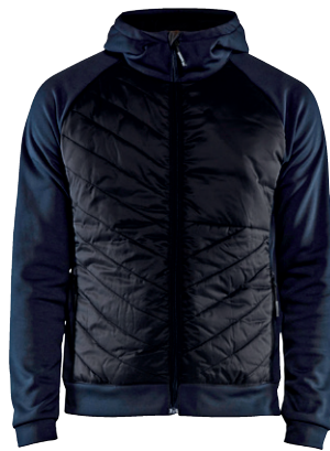
3463 / HYBRID SWEATER / 79.90€