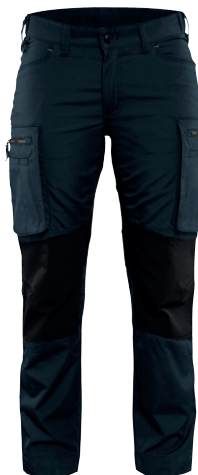
7159 / DAMEN SERVICE ARBEITSHOSE STRETCH / 73.90€