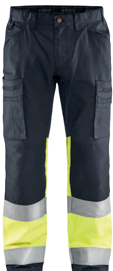
1551 / HIGH VIS ARBEITSHOSE MIT STRETCH / 84.90€