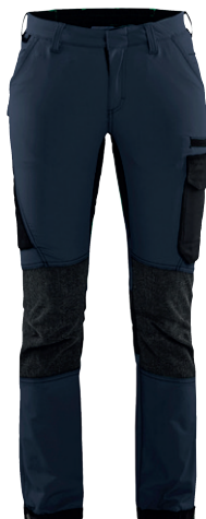
7122 / DAMEN SERVICE ARBEITSHOSE 4-WEGE-STRETCH / 95.90€