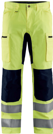
1585 / HIGH VIS ARBEITSHOSE MIT STRETCH / 88.00€