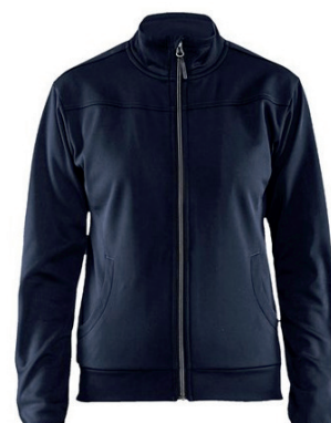
3394 / DAMEN SWEATSHIRT MIT REISSVERSCHLUSS / 43.90€