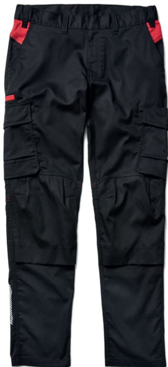
1448 INDUSTRIE ARBEITSHOSE STRETCH 56.00€