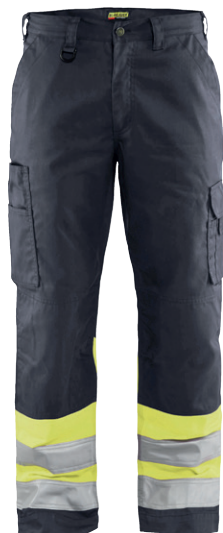
1564 / HIGH VIS ARBEITSHOSE / 63.50€